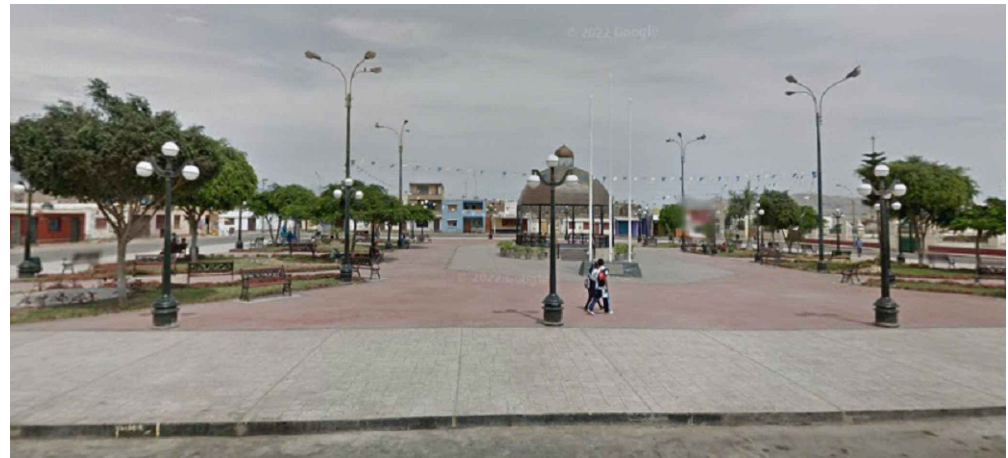
3. PLAZA DE CHILCA