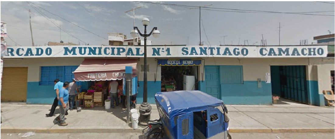
4. MERCADO MUNICIPAL