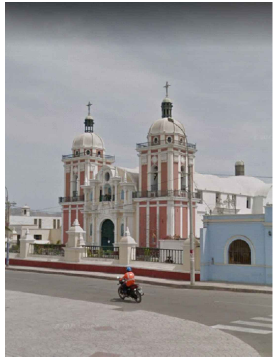
1. IGLESIA NUESTRA SEÑORA DE LA ASUNCIÓN DE CHILCA