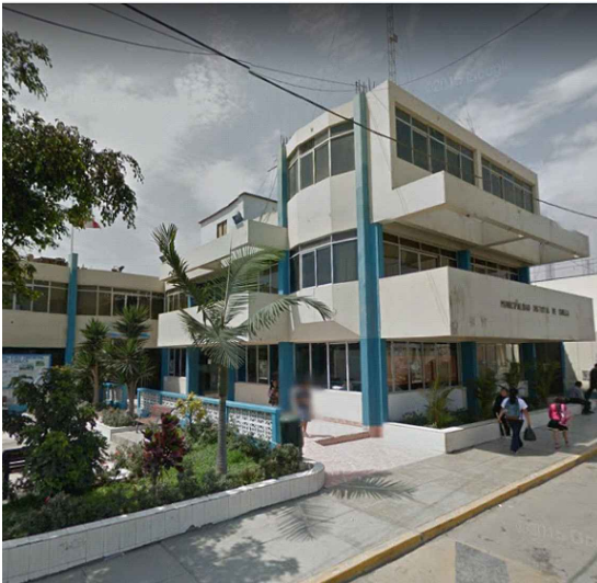
2. MUNICIPALIDAD DE CHILCA