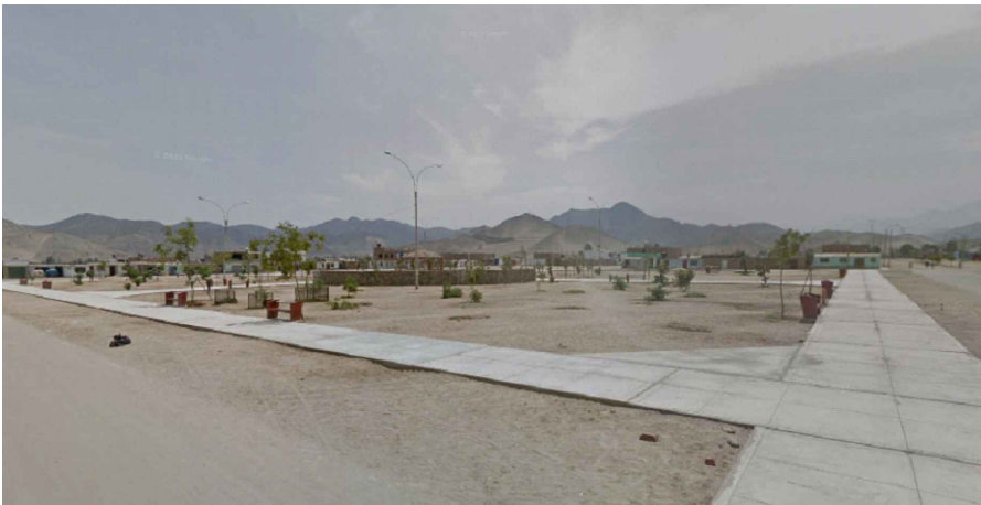
5. ASENTAMIENTO HUMANO 15 DE ENERO