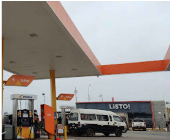
8. GRIFO PRIMAX