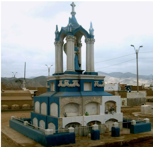
7. CEMENTERIO DE CHILCA