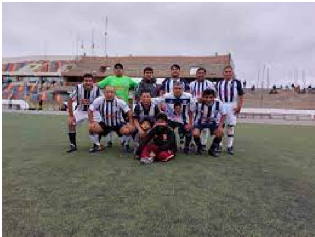
6. ESTADIO CHILCA